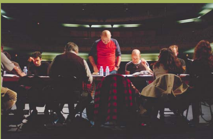
Calixto Bieito