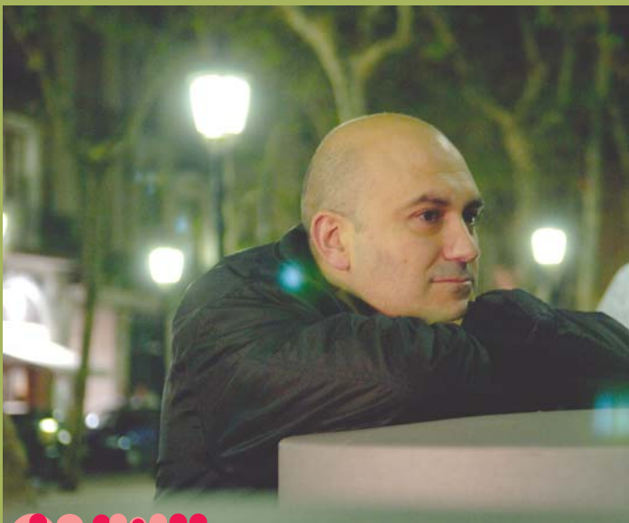
Calixto Bieito